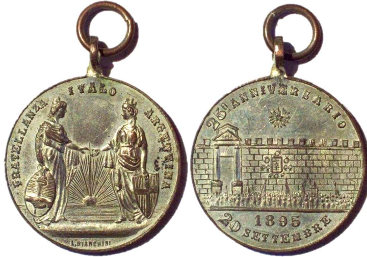
Anverso: FRATELLANZA ITALO ARGENTINA. Firma: L. BIANCHINI Reverso: 25° ANNIVERSARIO / 1895 / 20 SETTEMBRE

Metal: Plateado - Peso: 8gr - Módulo: 28mm - Rotación: 12hrs