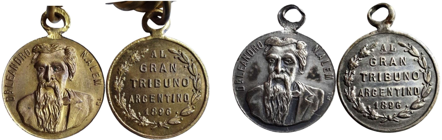
Anverso: DR. LEANDRO / N. ALEM. Firma: P.L. - Reverso: AL / GRAN / TRIBUNO / ARGENTINO / 1896

1896 - LEANDRO NICÉFORO ALEM - Código Moviarg: TFXX Metal: Dorado y Plateado - Peso: 2.9gr - Módulo: 18.07mm - Rotación: 12hrs