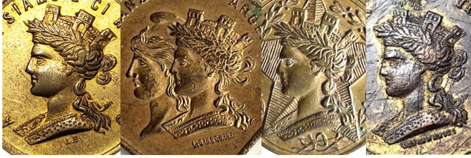
Medallas vistas previamente con sus códigos en el siguiente orden: PBRR - HJGR - LUAJ - CDDU

Es posible vincular las medallas firmadas L.B. con aquellas firmadas Ludovico Bianchini , para ello es necesario analizar el campo de cuatro medallas que hemos visto anteriormente, las cuatro figuras que representan a Italia poseen características similares y seguramente provengan del mismo punzón.