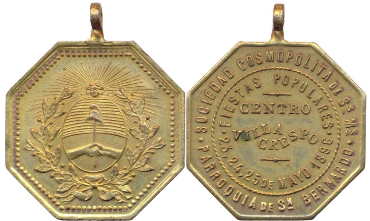
Anverso: Reverso: SOCIEDAD COSMOPOLITA DE SS. MM. / PARROQUIA DE SN. BERNARDO / FIESTAS POPULARES / CENTRO / VILLA / CRESPO / 23, 24, 25 DE MAYO 1896

Metal: Bronce - Peso: 9.25gr - Módulo: 28mm - Rotación: 12hrs